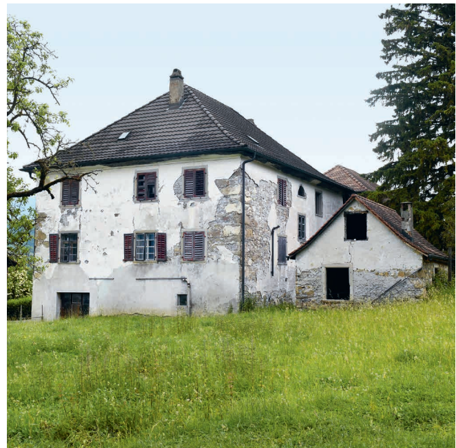
Abb. 1: Südostansicht des Wohnhauses; Foto vom Juni 2021.