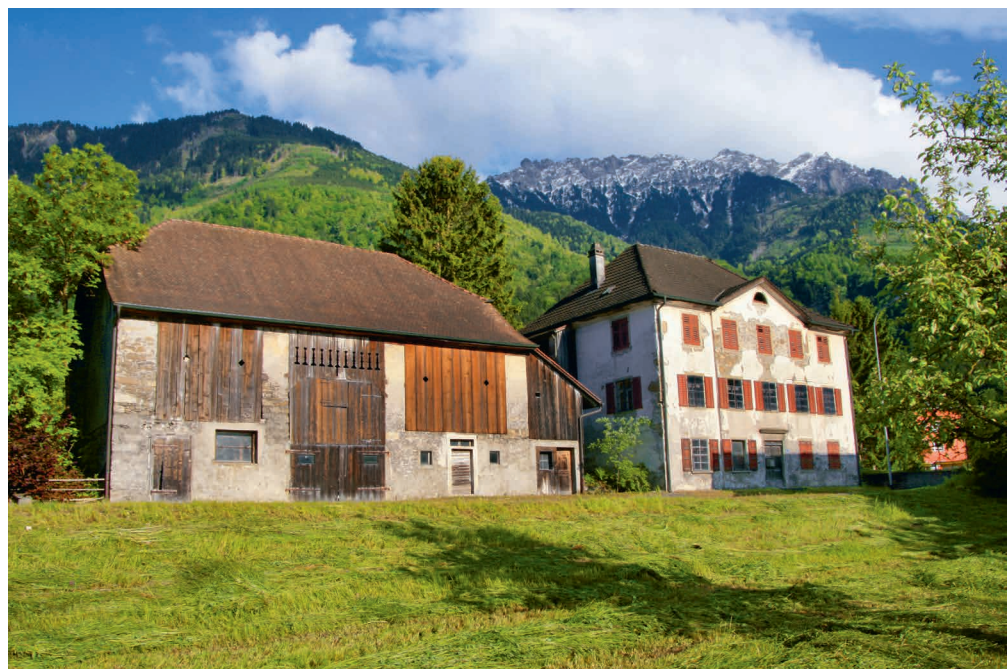
Abb. 2: Wohnhaus und Stallgebäude, von der Feldkircher Strasse aus gesehen; Foto vom Mai 2013.