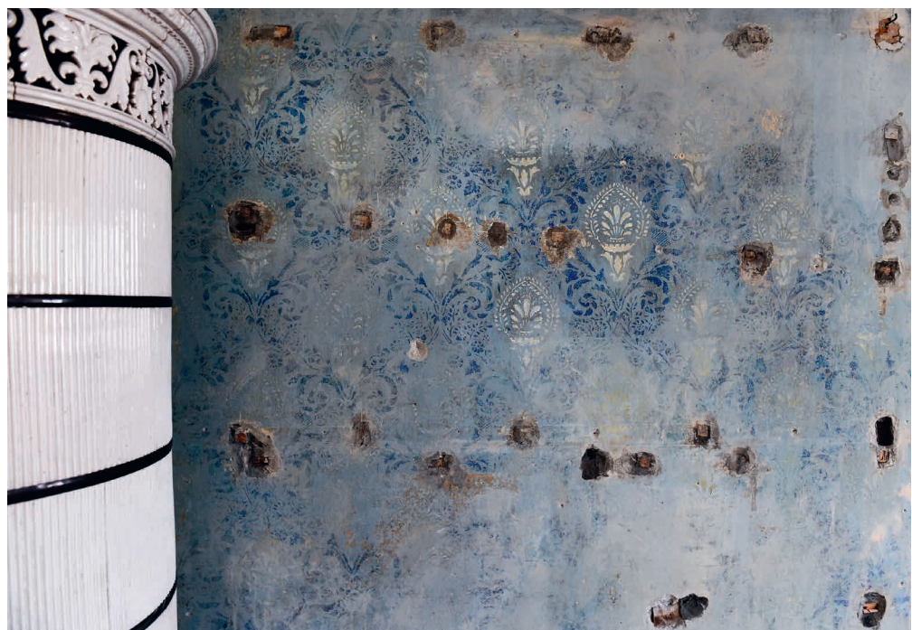
Abb. 12: Zylinderkachelofen und Wandmalereien nach der Freilegung im blauen Salon; Foto vom 23. März 2023.

Auf die Beschaffung von Materialien aus originären Quellen wurde Wert gelegt. Diese kommen, je nach Befund, aus dem Schwarzach Tobler Steinbruch (Vorarlberg) oder aus dem Kanton St. Gallen (Rorschacher Sandstein). Auch viele interessante Details, über die Umwege und erst im Trial-and-Error-Verfahren entwickelten Lösungen kann an dieser Stelle nicht weiter eingegangen werden. Die Erfahrungen, die wir gemacht haben, sind gewiss bauhistorisch-architektonisch-technisch sehr interessant und vermutlich für andere Sanierungsprojekte historischer Gebäude auch lehrreich. Wir beabsichtigen, sie an anderer Stelle darzulegen.