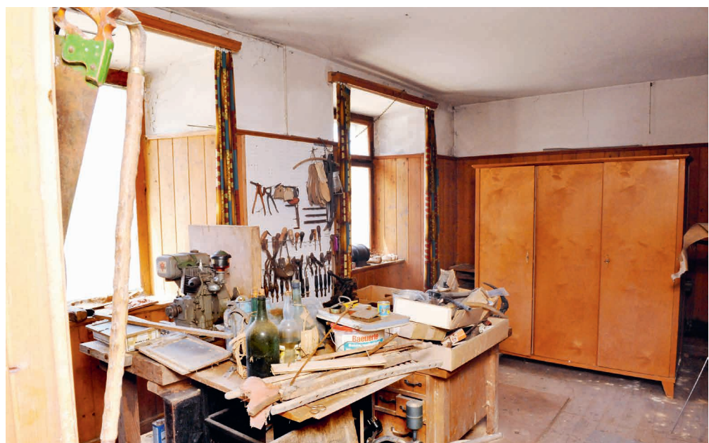
Abb. 5: Schusterwerkstatt im Erdgeschoss; Foto aus dem Jahr 2002.

Das Hagenhaus blieb nicht das einzige klassizistische Gebäude in Liechtenstein. Die klassizistische Architekturrevolution schwappte bereits mit Biedermeier-Einschlag auch über unser Land herein. Einige wenige wagten sich vor, indem sie in das baukulturelle Mittelalter «neumodische» Zeichen setzten, wie eben mit der