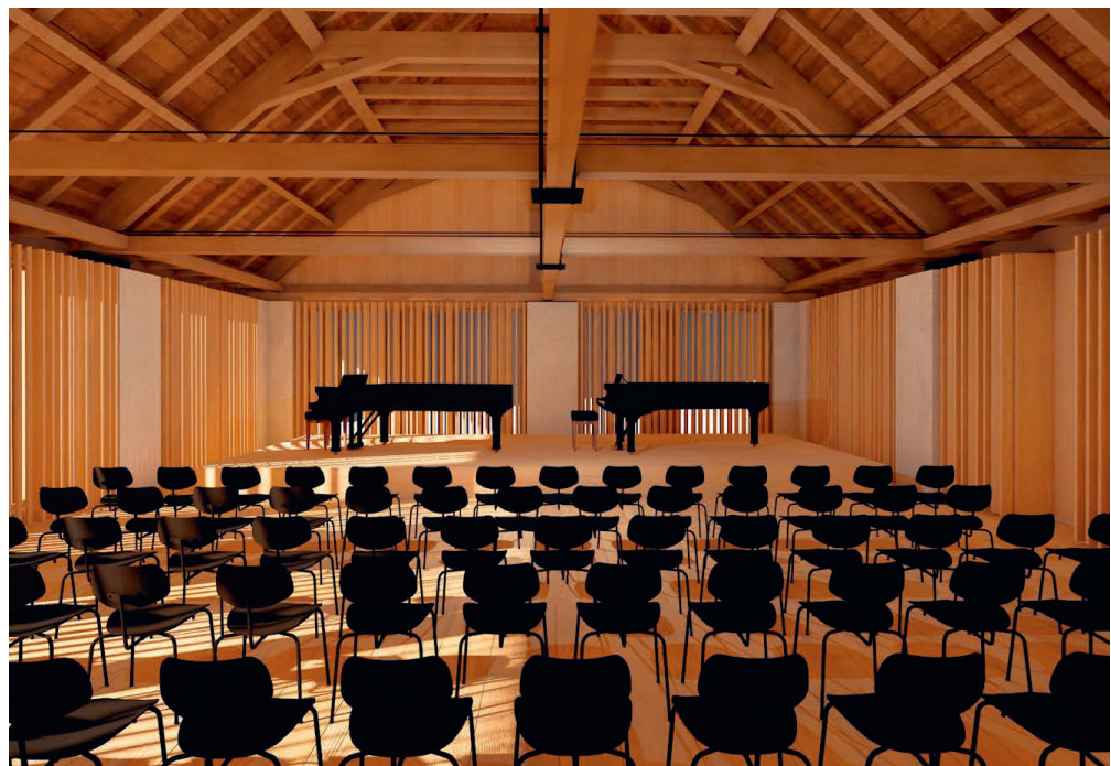
Abb. 13: Visualisierung des zukünftigen Peter-Kaiser-Konzertsaals.