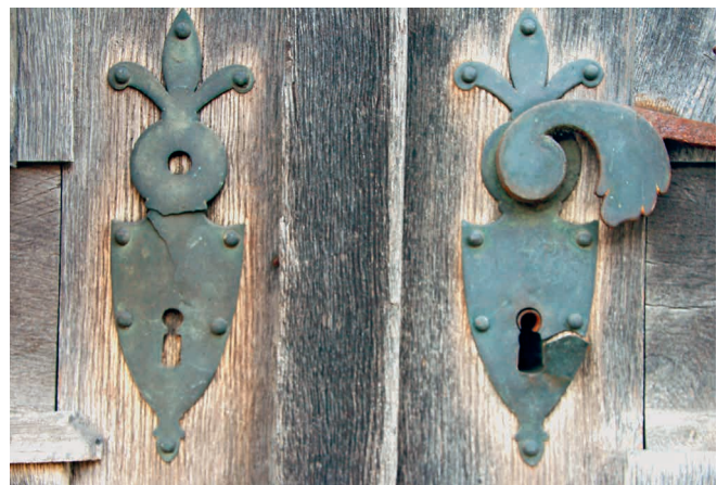
Abb. 4: Biedermeier Drücker- und Türschild am Eichenportal; Foto vom Mai 2013.

Beginnen wir mit unserer ersten Inaugenscheinnahme der Gebäude im Zustand, der sich vor der Renovation bot. Die Hofstätte «Alte Post», nach der letzten Bewohnerfamilie auch als «Hofstätte Hagenhaus» 13 bezeichnet, umfasst ein Doppelwohnhaus, eine Stallscheune, das Waschhaus und das Schützenhäuschen. Die vier Baukörper stehen frei für sich, sind aber klar ersichtlich als Ensemble angeordnet. Das Stallgebäude ist nicht, wie bei unseren Bauernhäusern üblich, 14 mit dem Wohnhaus verbunden, sondern wurde – wie bei Gebäuden des Adels 15 – in gebührendem Abstand davon errichtet. Dies kann als erster Hinweis auf den bürgerlichen Anspruch gedeutet werden, welchen diese Hofstätte ausstrahlen sollte. Auch wenn der Abstand zwischen Wohnhaus und Stallgebäude nur wenige Meter beträgt, sollte diese zum Ausdruck bringen, dass hier zwar eine damals auf dem Lande überlebenswichtige Landwirtschaft betrieben wird, zu der man sich aber auf Distanz hält. Dies sollte